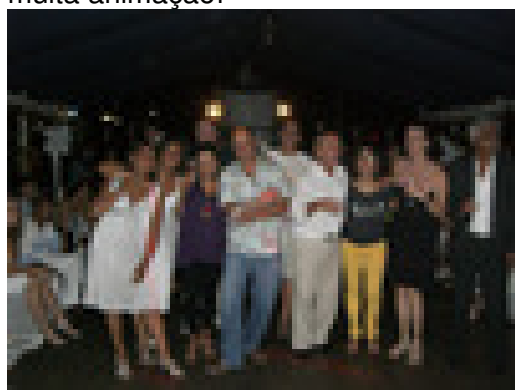
Festa de fim de ano no dia 18 de dezembro

Em 2007, nossa já tradicional confraternização de final de ano inovou: a festa foi no barco "Casablanca", que percorreu alguns pontos da Baía de Guanabara (Ponte Rio-Niterói, Ilha Fiscal, Urca). Foi uma noite de música, dança e muita animação!