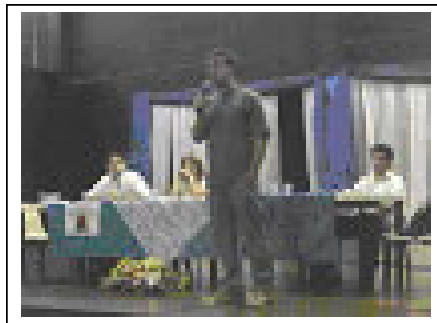
Deputado Marcelo Freixo no Teatro da Unidade Tijuca II, argumentando contra a redução da maioridade penal

Organizamos dois debates sobre esse tema durante o ano de 2007. O 1º ocorreu na Unidade Humaitá II, no dia 2 de julho, e contou com a presença do deputado estadual Marcelo Freixo (PSOL). Já no 2º debate, realizado na Unidade Tijuca II no dia 17 de agosto, ao lado de Marcelo Freixo, tivemos também a participação do deputado Flávio Bolsonaro (PP). Um outro debate sobre o mesmo tema, organizado pelo Grêmio de São Cristóvão, ocorreu no dia 27 de setembro e contou com o apoio da ADCPII.