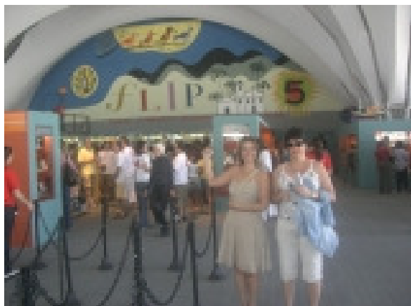
Associados da ADCPII na V FLIP