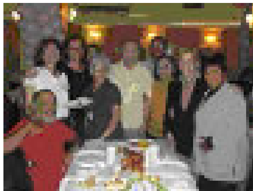
Associados na Confeitaria Manon