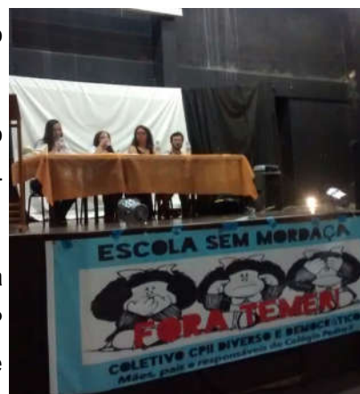
Abertura da Frente CPII sem Mordança.

Os três palestrantes fizeram uma análise sobre a onda conservadora no mundo e no Brasil, que por meio da formação de grupos como o ESP (Escola Sem Partido), visa atacar a escola e a livre-docência com calúnias e difamações.