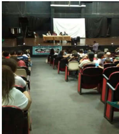
Auditório do Campus Tijuca II.